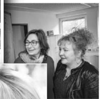
...kt zur Unterstützung des Demo-

Neues Projekt des Diakonischen Werks Syke läuft